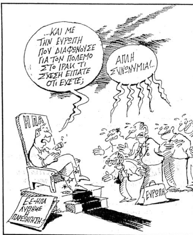
Του ΤΟΛΙΑΔΗ - ΑΠΟ ΤΟ «ΕΘΝΟΣ»

Κυπριακό: Οι Αγγλοαμερικάνοι, όπως οι ίδιοι ομολόγησαν, προσπάθησαν να χαρίσουν την Κύπρο στην Τουρκία μέσω του σχεδίου Ανάν, για να εξασφαλίσουν, ως αντάλλαγμα, όλες τις διευκολύνσεις που τους ήσαν απαραίτητες για τον πόλεμο στο Ιράκ. Η Ε.Ε. σε κάθε ευκαιρία εξέφρασε την πλήρη υποστήριξή της στο κατάπτυστο σχέδιο, παρότι παρα-