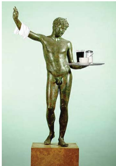
Ο Ερμής του Πραξιτέλη όπως τον θέλει η Ε.Ε.

Τα μεταγενέστερα είναι περισσότερο γνωστά, με μόνη θετική παρένθεση το κίνημα του Φιλελληνισμού των λαϊκών επαναστατικών ευρωπαϊκών κινημάτων κατά την ελληνική επανάσταση του 1821, που όμως δεν απέτρεψε τελικά τα δεσμά, που ακόμη μας ταλανίζουν, των Προστάτιδων Δυνάμεων!