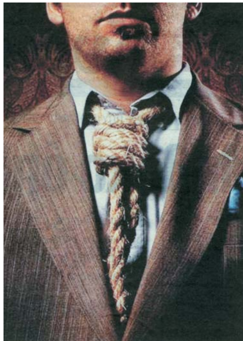
Τα νέα οικονομικά μέτρα της Ε.Ε.

Η αποχώρηση της χώρας από την Ε.Ε. θα δημιουργούσε πολύ καλύτερες προϋποθέσεις από τις σημερινές, ανεξαρτήτως κοινωνικού συστήματος.