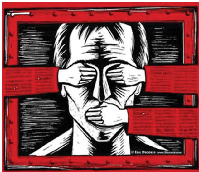
Η διαφάνεια της Ε.Ε.

Σ' ένα δημοκρατικό πολίτευμα η Βουλή νομοθετεί και η Κυβέρνηση κυβερνά, στα πλαίσια των νόμων. Όλα μπορούν να γίνονται με διαφάνεια και ο λαός τελικά μπορεί να αποφασίζει ποιους πρέπει να επανεκλέξει και ποιους να αντικαταστήσει, κρίνοντας κατά πόσο τα έργα τους ήσαν σύμφωνα με τα προγράμματα που είχαν διακηρύξει. Με τη συμμετοχή μας στην Ε.Ε., όμως, κανείς Έλληνας πολίτης δε γνωρίζει ποιος, πώς και τι αποφασίζει για τα κυριότερα θέματα που τον αφορούν. Τις αποφάσεις παίρνουν οι επίτροποι της Κομισιόν, που είναι διορισμένοι και δε λογοδοτούν στους λαούς, οι τραπεζίτες της Ευρωπαϊκής Κεντρικής Τράπεζας (ΕΚΤ), που επίσης δεν ελέγχονται από τους λαούς, και τα Συμβούλια των Υπουργών, οι μόνοι που εκλέγονται. Αλλά και σ' αυτά τα Συμβούλια στην πράξη ο Έλληνας υπουργός είναι ανίσχυρος μπροστά στις εισηγήσεις του επιτρόπου, που υποστηρίζεται από μια τεράστια γρα-