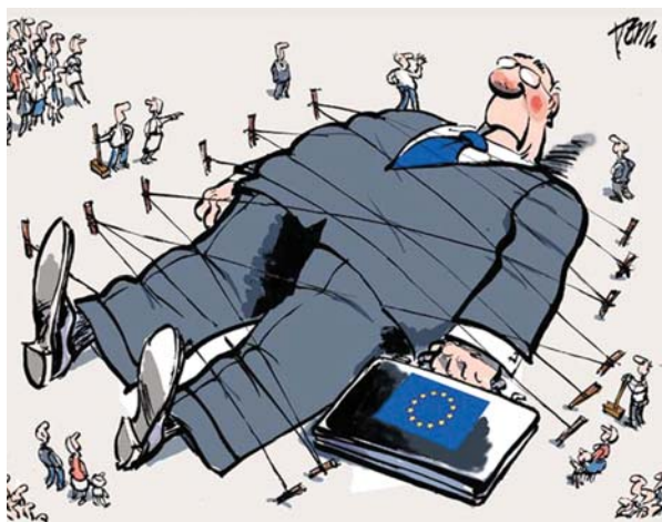
Το Διευθυντήριο και οι λαοί

Δεν είναι η πρώτη φορά που δημιουργήθηκε ή επιχειρήθηκε ένωση ευρωπαϊκών λαών. Στην αρχαιότητα πρώτη η Κελτική (Γαλατική) περίοδος, μετά η Ρωμαϊκή-Λατινική . Ακολουθεί η Γερμανική (Φράγκικη), με κύρια μορφή τον Καρολομάγνο (800 μ.Χ.), που η Ε.Ε. θέλει να καθιερώσει ως την αρχή της ευρωπαϊκής ιστορίας(!), σε συνδυασμό με την καισαροπαπική της καθολικής Ρώμης, και πάντοτε με εχθρικές-καταστροφικές συνέπειες για την Ελλάδα. Αποκορύφωμά τους οι ληστρικές σταυροφορίες , η πρώτη «αποικιακή» εξόρμηση συνολικά της Δυτικής και Κεντρικής Ευρώπης.