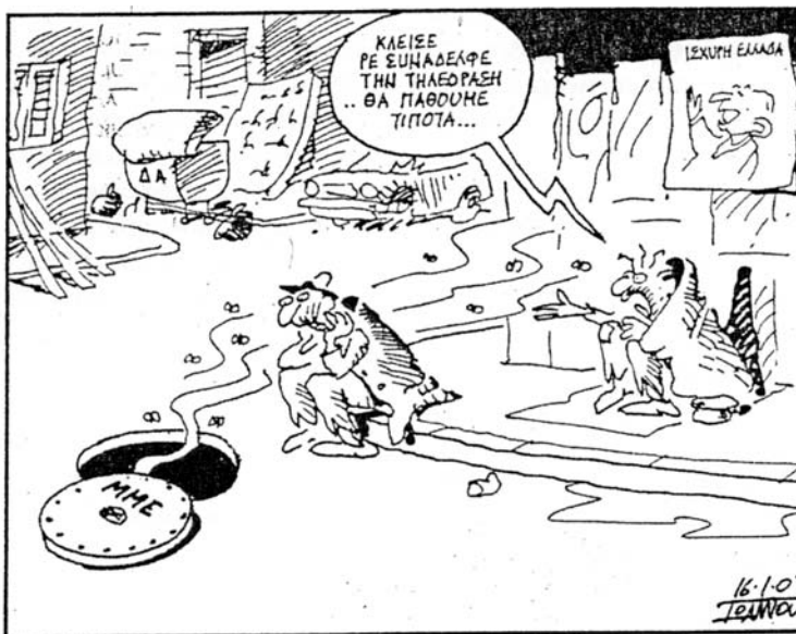
Του ΠΑΝΗ ΙΩΑΝΝΟΥ - ΑΠΟ ΤΟ «ΕΘΝΟΣ»

Οι ευρωπαϊστές μας, με σημαιοφόρους τα χρηματοδοτούμενα Μ.Μ.Ε., πανεπιστημιακούς, «διανοούμενους» και εκδότες, αφού δεν τολμούν πλέον (στο αποκορύφωμα της οικονομικής κρίσης, που προκάλεσαν οι Αμερικανοί και οι σύμμαχοί τους της Ε.Ε.) να ισχυριστούν πως η Ε.Ε. μας εξασφαλίζει ευημερία, μας προστατεύει από τους εχθρούς, στέκεται φρουρός της δημοκρατίας μας, προωθεί τον